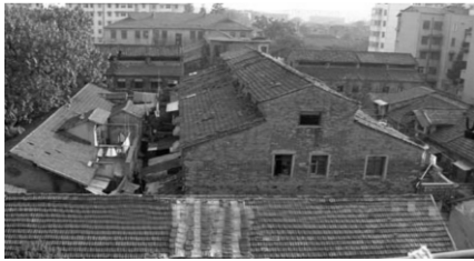
图 3 古城主体十字楼

模范监狱的整体建筑形式为西式风格(见图 3),主监房的尺度较大,外形为十字形,简洁明晰,走道屋顶采用通直的天窗,类似于早期的工业建筑,墙体高处开小窗,室内光线较差,但这为未来建设成为典狱博物馆创造了先决条件. 模范监狱入口大门的山花建造是采用简化的巴洛克式,立面效果颇佳;而一些次要建筑则采用中国传统形式 [5] .