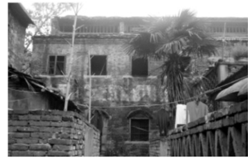
图 4 模范监狱东向主楼东北向的现状(由北向南)

2.4 现状问题 模范监狱的现状场地,由于居住人口密集和使用不当等原因,场地状况较差(见图 4). 由于年久失修,模范监狱的主监房的木质楼梯坍塌,天花板与地板毁损严重,大门墙体、砖柱、檐口都已经严重破损;围墙墙体歪斜、残破现象较为严重;其次,在此居住的居民对建筑功能提出了新的要求,如接电话、网络、增加空调等设备;下水管道被扩容,有些大尺度空间被开发成旱冰场、零售店等,这些功能的加入破坏了建筑的形态 [5] .