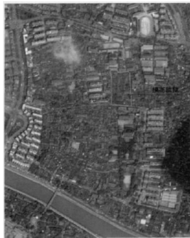
图6 模范监狱航拍图